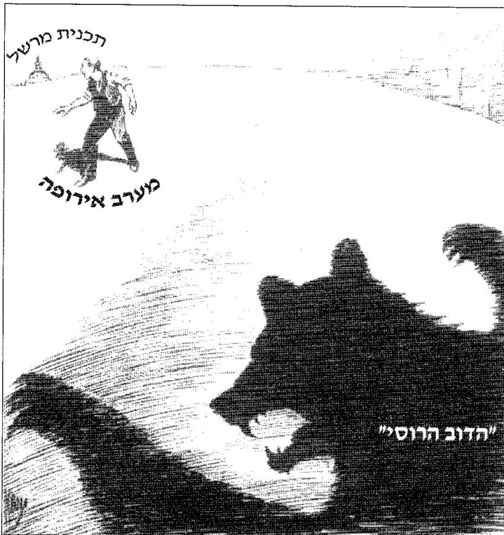
בזמן שהצל מתארך

התבונן בה, וענה על שני הסעיפים א-ב שאחריה.